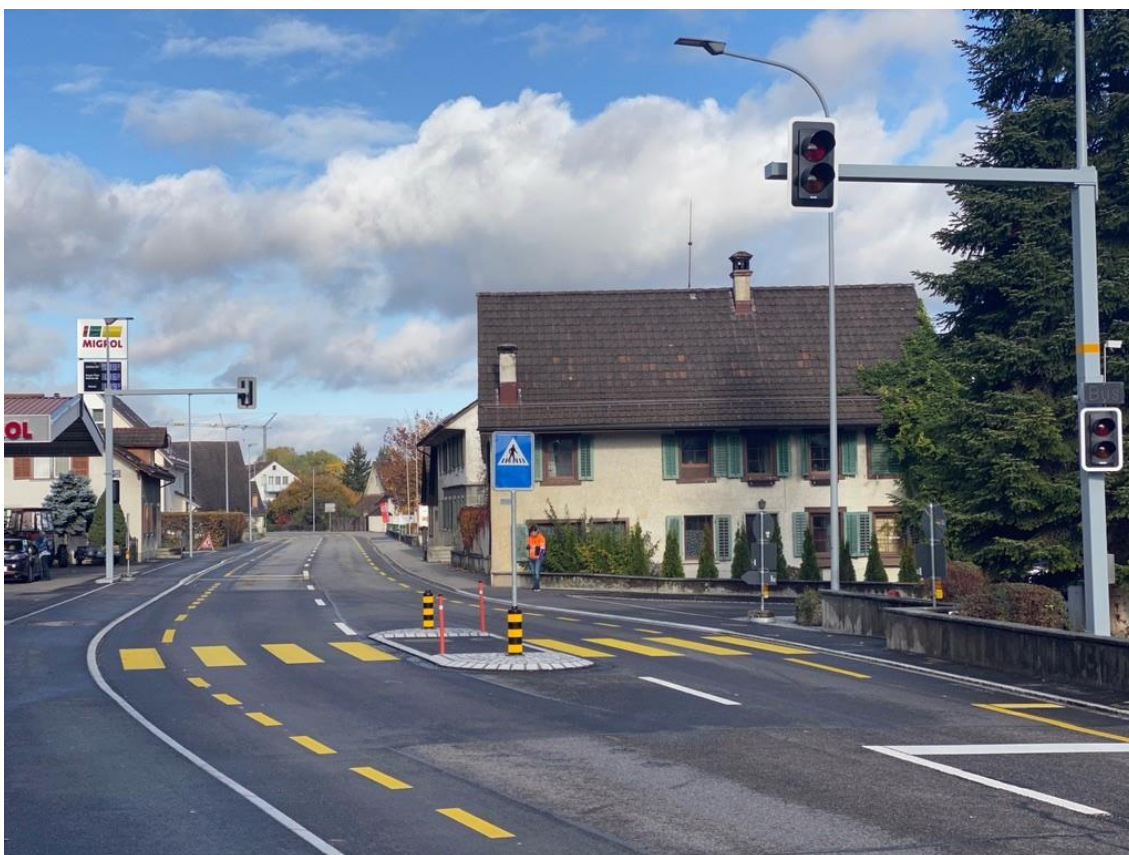
Bild 1: Weiacherstrasse, Blick Richtung Glattfelden – Lichtsignalanlage Busbevorzugung Kreuzung Kirchgasse

Die Verkehrsbelastungen auf der Weiacherstrasse nahmen stetig zu und wurden immer mehr zum Verkehrssicherheitsproblem. Speziell die schwierige Einmündung der Busse der PostAuto AG von der Kirchgasse in die Weiacherstrasse führte zu kritischen Verkehrssituationen. Als Lösung wurde der Knoten Weiacherstrasse / Kirchgasse mit einer LSA umgebaut. Zudem wurden einige kleinere Anpassungen an den Gehwegüberfahrten sowie an der Fussgängerschutzinsel umgesetzt. Im Zuge der Knotenumgestaltung wurden gleichzeitig Bedürfnisse für die Kanalisation der Gemeinde Rorbas sowie eine Rohrblockanlage der Elektrizitätswerke des Kantons Zürich (EKZ) realisiert.