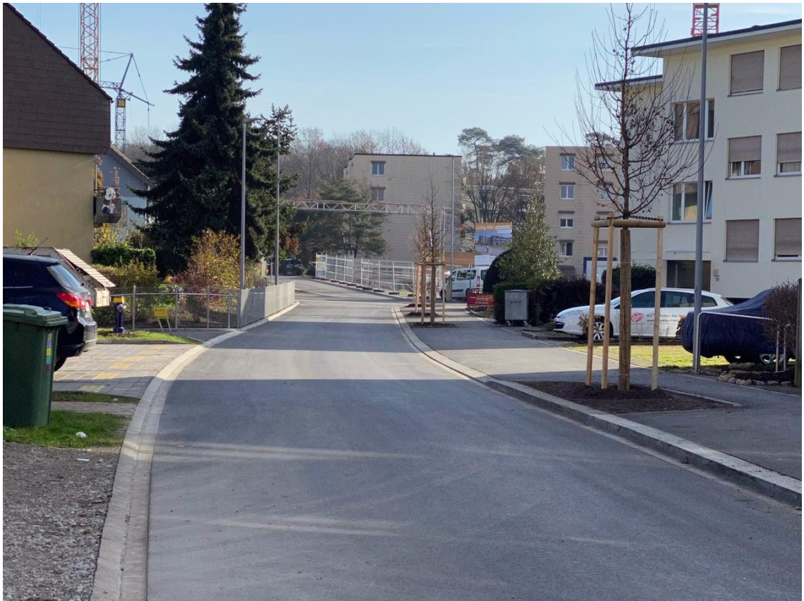
Bild 2: Bücklerstrasse, Abschnitt West, Blick Richtung Kreuzung Fuhrstrasse