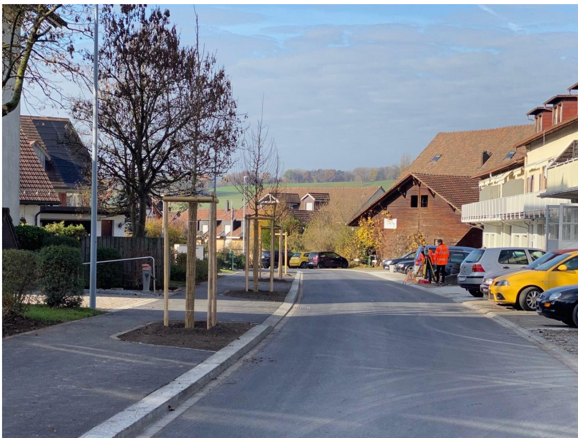
Bild 1: Bücklerstrasse, Abschnitt West, Blick Richtung Sonnenbühlstrasse

Die Massnahmen aus dieser Studie wurden durch die Ingenieurbüro Gujer AG fertig projektiert und nun realisiert.